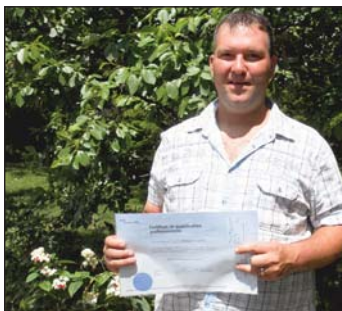
Remise des certificats, printemps 2010.