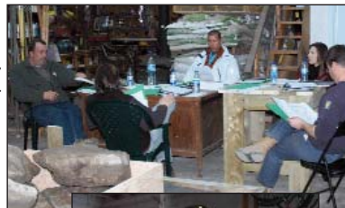
Préparation, automne 2009.

Les personnes intéressées à se prévaloir de ce service ou qui souhaitent obtenir davantage d'information peuvent communiquer avec HortiCompétences, par téléphone, au 450 774-3456 , ou par courriel, à catherine.lamothe@horticompetences.ca .