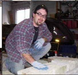
Évaluation des candidats, hiver 2009-2010.